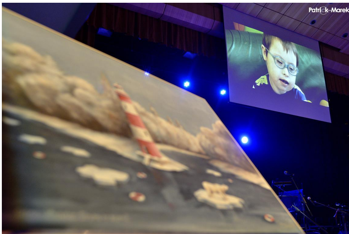
Vydražený obraz Cape Hradec Town spolu s promítáním během koncertu