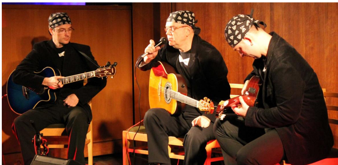
Otec a dva synové – to je TRIO BALKAN STRINGS

Jsme potěšeni, že toto netradiční trio složené z otce a dvou synů zavítalo také do Městské hudební síně v Hradci Králové. Jednalo se o exkluzivní koncertní vystoupení v rámci turné po České republice. Koncert plný balkánské hudby s asymetrickými rytmy a originální interpretací na kytaru. Netradiční, svěží, spontánní a energická prezentace kytarové hudby – tak se dalo popsat toto vystoupení. Zazněly aranže nejen tradičních balkánských melodií, ale také legendární kapely jako jsou například Deep Purple. Nesmělo chybět ani hraní 6 rukou na 1 kytaru, které je pod jejich ochrannou známkou.