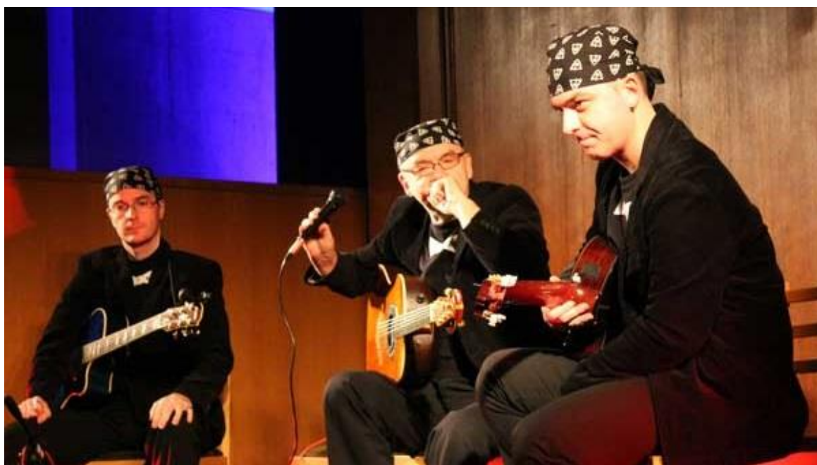
Městskou hudební síň se rozezněly balkánské melodie