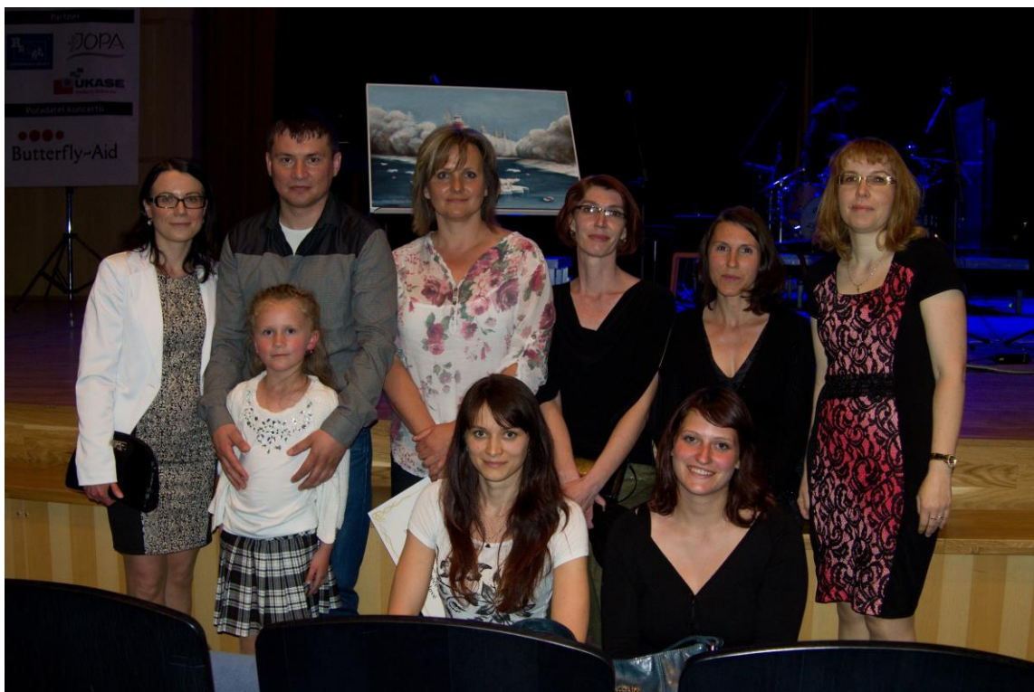
Tým ze Střediska rané péče Sluníčko spolu s vydražitelem obrazu