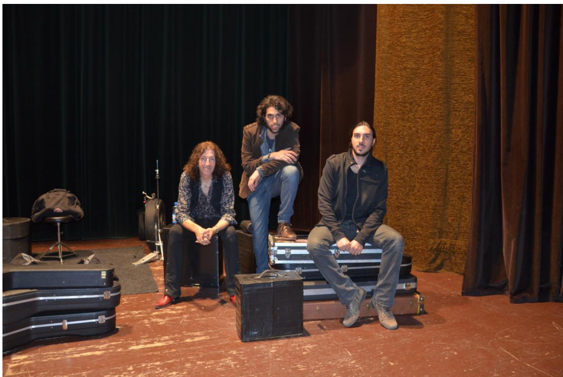
Kompletní trio společně po koncertě