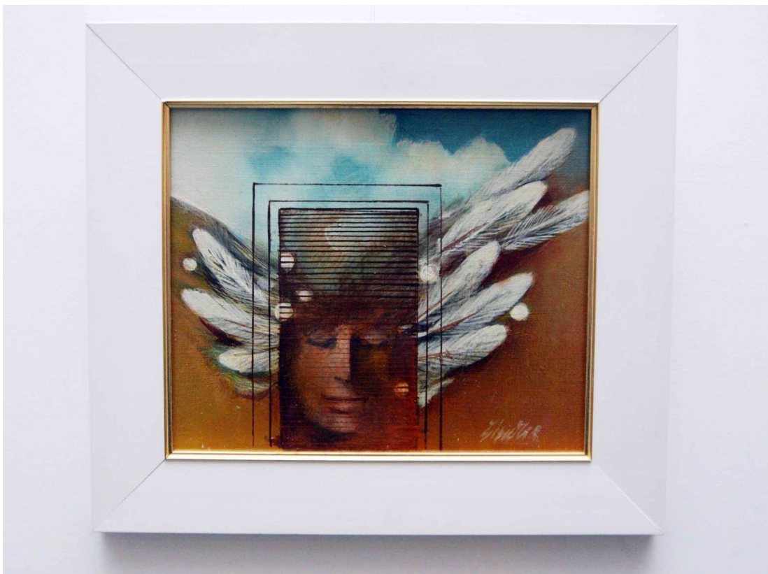
Dražený obraz Jiřího Šindlera