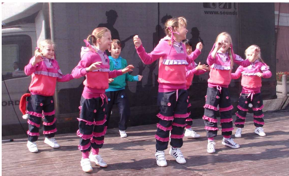
T-BASS během vystoupení