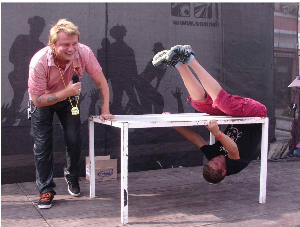
Děti soutěže i zpívání baví