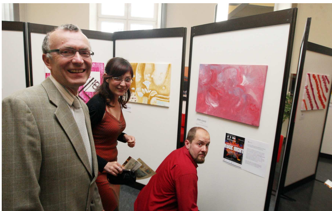
Obrazy se kupujícím líbily.