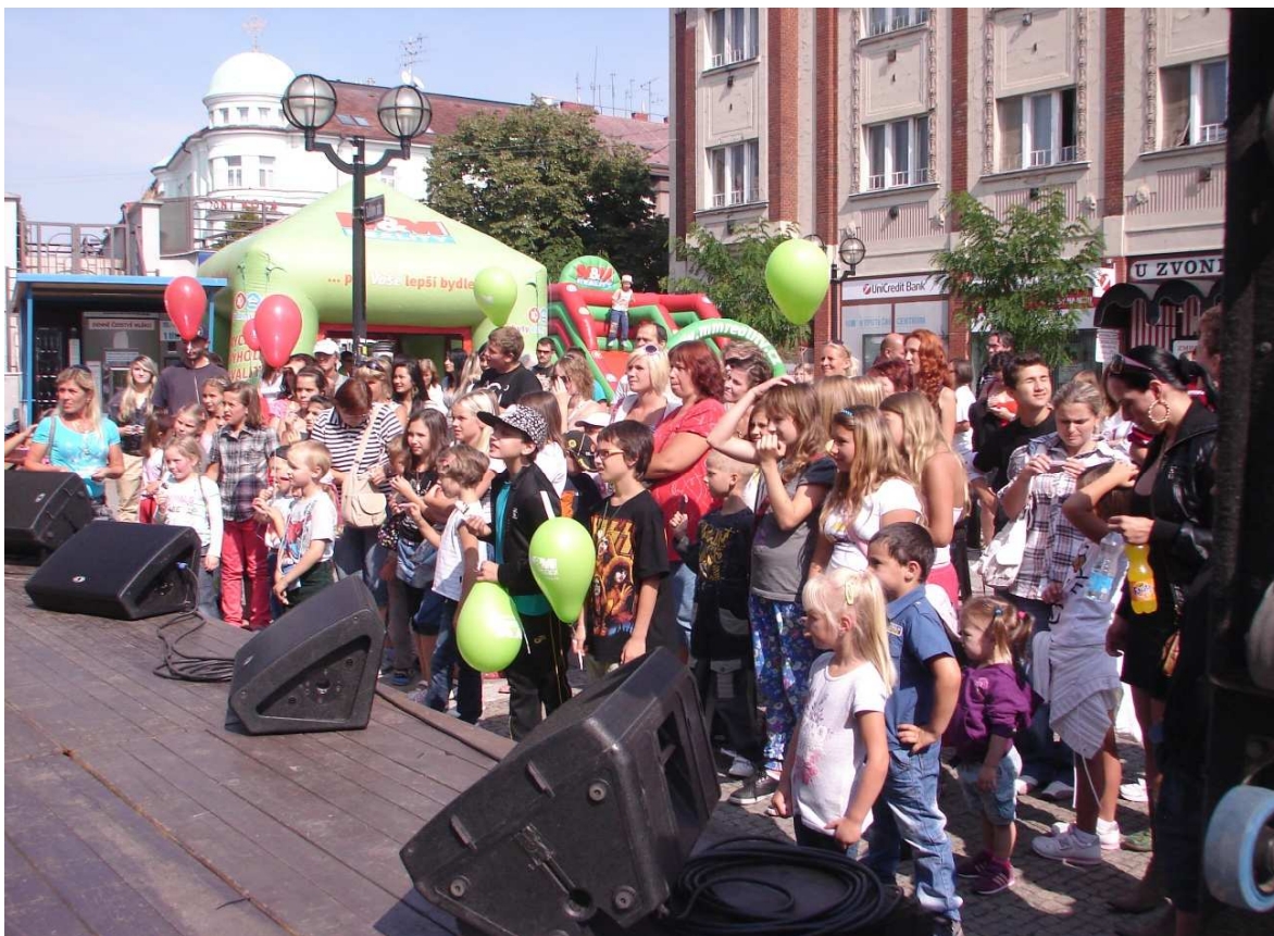
Bačkovské náměstí v první školní den