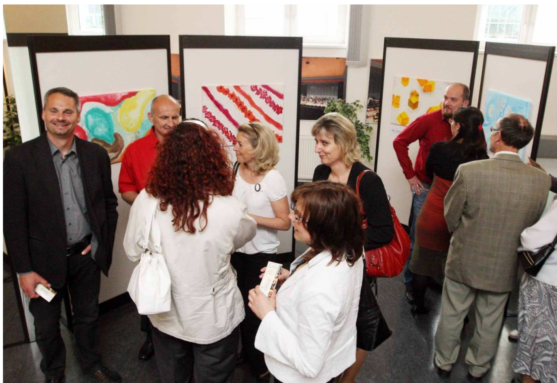
Výstava obrazů ve foyer Filharmonie Hradec Králové