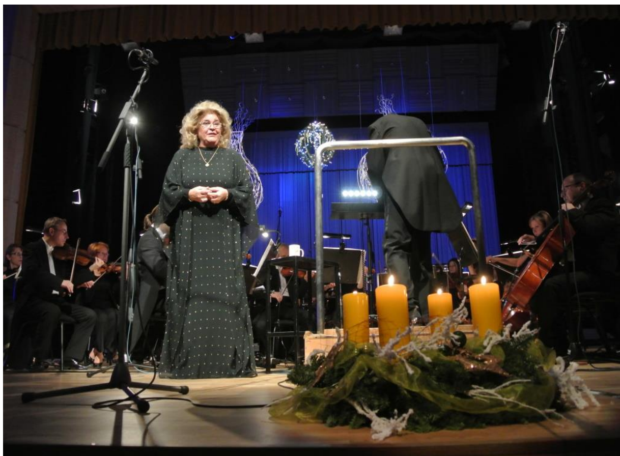
Koncert měl nádhernou vánoční atmosféru