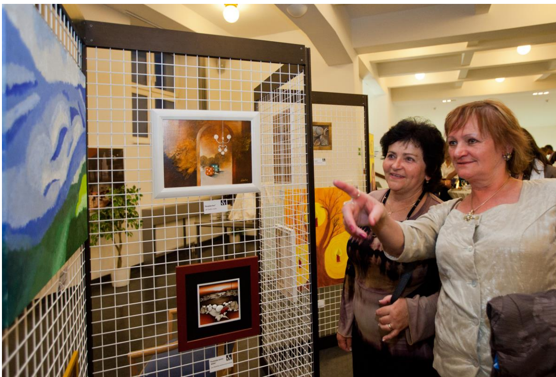
Obrazy se kupujícím líbily.