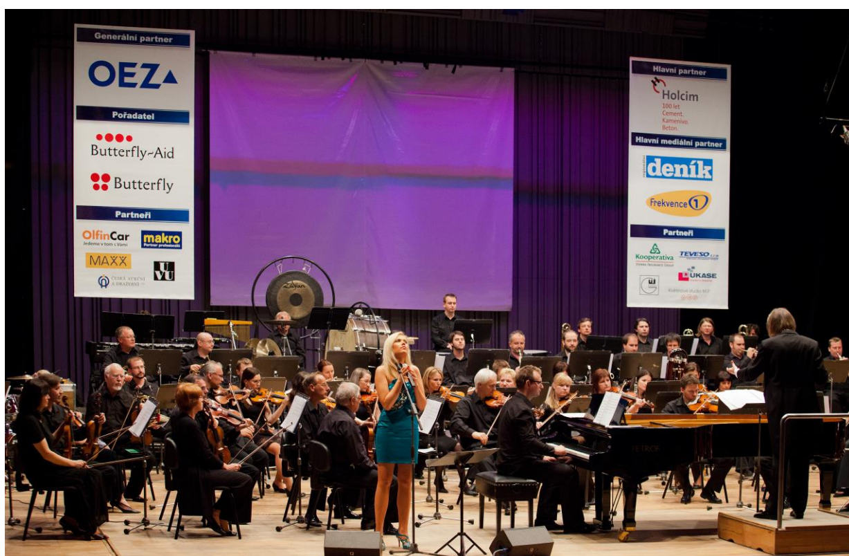
Dražbě předcházely koncert „Music For Hollywood“