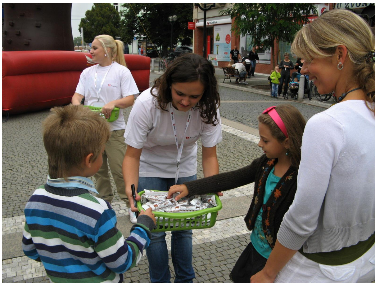
Baťkovo náměstí v první školní den

Hvězdou odpoledne byla Hannah Montana revival. Dalšími vystupujícími byla taneční skupina T-BASS (mini děti, break dance a vicemistři Evropy v dětských formacích). Akci moderoval Zdeněk Lukesle. Prvních 300 dětí dostalo pro osvěžení PRIMA zmrzlinu.