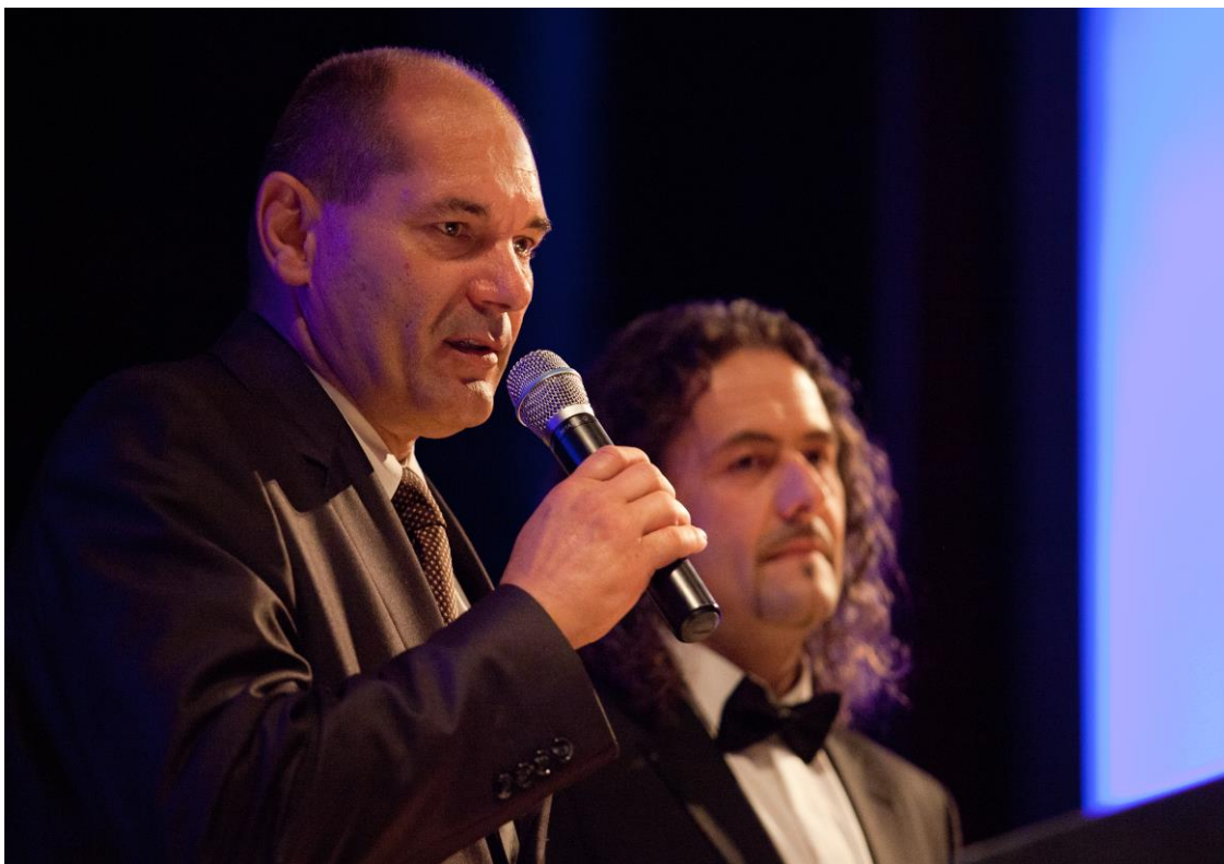
Ředitel dětského domova děkuje vydražitelům