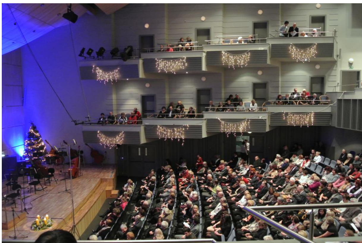
Sál Filharmonie byl nabitý k prasknutí