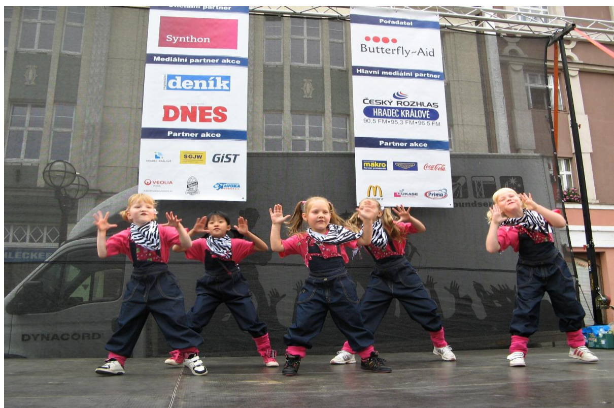
T-BASS během vystoupení