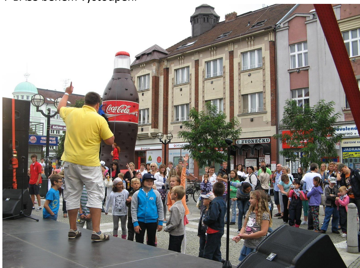
Děti zpívání i soutěže baví