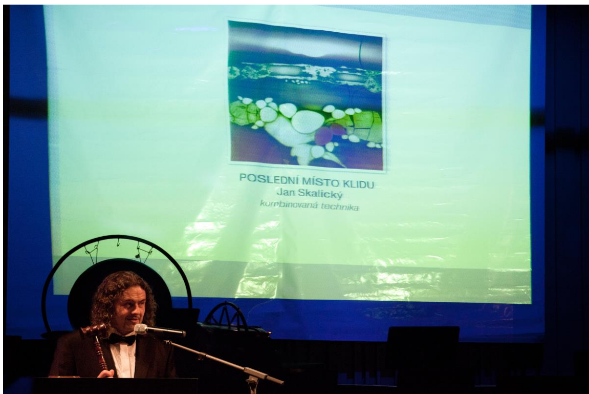
Moderátor akce při dražbě