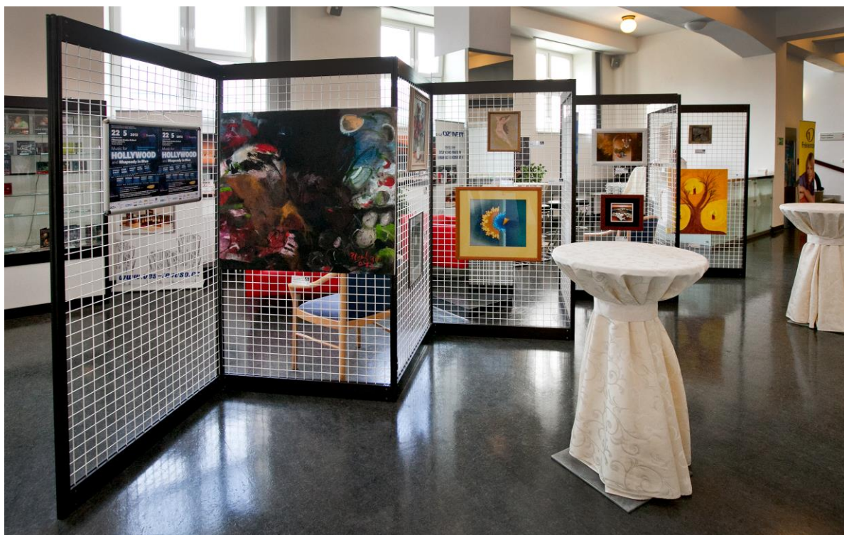
Výstava obrazů ve foyer Filharmonie Hradec Králové