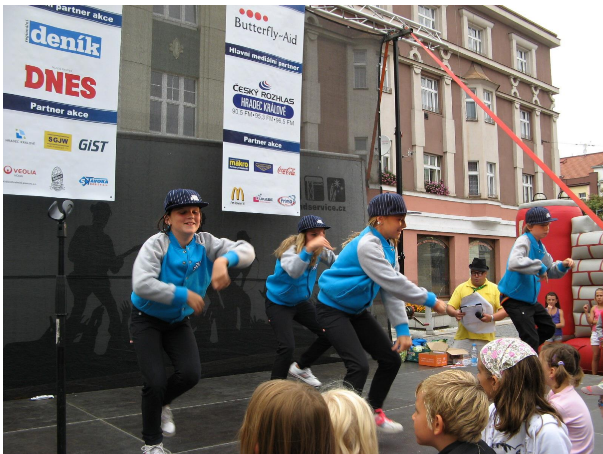
Děti soutěže i zpívání baví